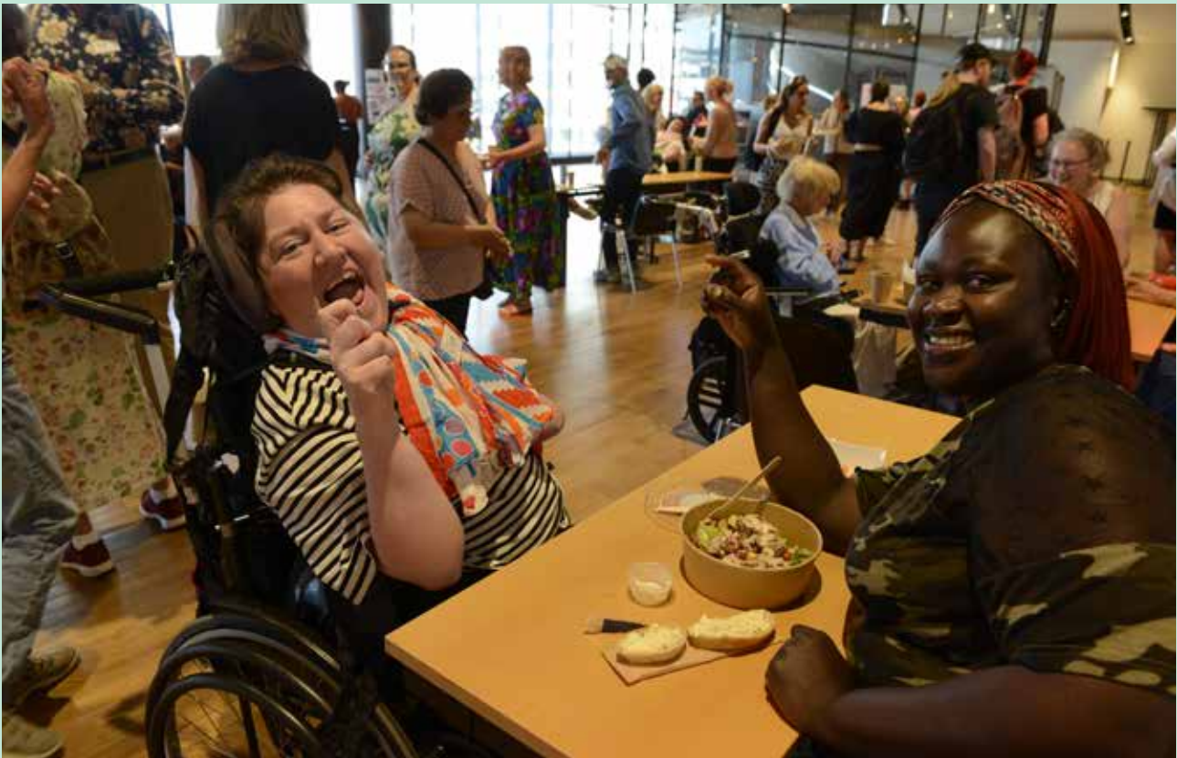
Stora Assistentdagen på Kulturhuset i augusti

kommunerna. Under året har dock fler av JAGs medlemmar fått dessa behov accepterade av myndigheterna. Vi hoppas att det är en ny trend.